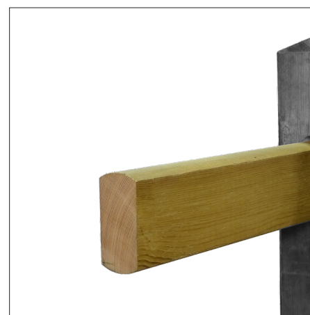
Nevada kan levereras i både grön- och brunimpregnerad furu

Som ett alternativ till den välkända gröna impregneringsfärgen kan Nevada mot ett blygsamt pristillägg levereras brunimpregnerat. Observera att allt utomhusträ regelbundet ska efterbehandlas om man vill ha permanent färg.